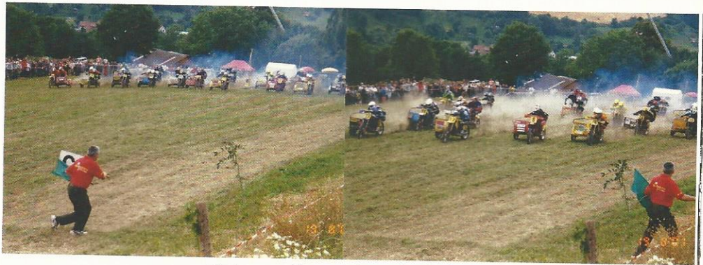
Motocross-Veranstaltung in Geisleden

Ihre letzte, die 61. Motocross Veranstaltung auf der Rennstrecke in Apolda „Am Tannengrund“ organisierten die Mitglieder des 1.