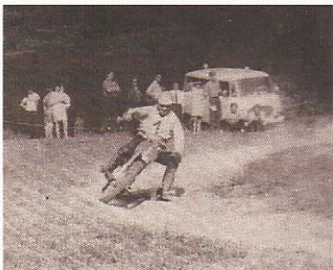
Paul Friedrichs gewinnt 1972 den „Pokal der Kalikumpel“

Aus der „Sportvereinigung Deutsche Volkspolizei“, die bereits am 20. Juni 1950 mit Befehl 119/50 des Chefs der Deutschen Volkspolizei gegründet wurde, entstand die Sportvereinigung Dynamo. Sie wurde mit Beschluss des Gründungskongresses am 27. März 1953 ins Leben gerufen. In den 50er-Jahren wurden in den damaligen DDR-Bezirken Trainingsstätten, Sektionen, Kinder- und Jugendabteilungen und andere Einrichtungen der SV Dynamo gebildet.